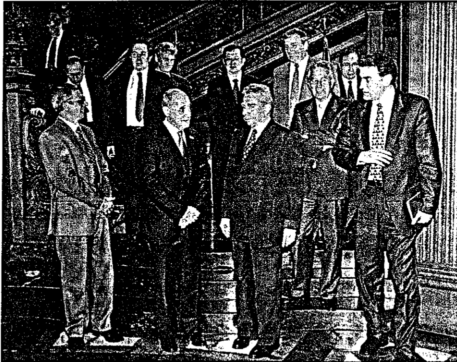
Lavagna se reunió con los embajadores del Grupo de los Ocho.

No se harán más ajustes. Se estrechará la relación con Brasil. Procurarán la igualdad educativa y mayor prevención del delito.